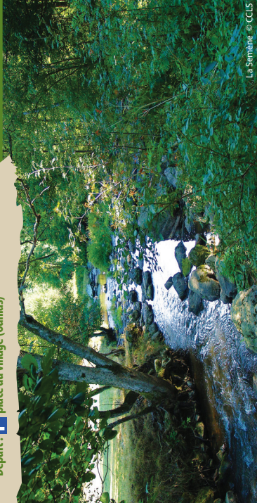
La Semène

Cet itinéraire vallonné vous permettra de traverser à deux reprises le Semène et de découvrir les petits villages pittoresques de sa vallée. D'Ouilhas à la Méane, en passant par Oriol, Lafayette et Creux, c'est tout le riche passé médiéval, artisanal et industriel de la vallée de la Semène que vous pourrez contempler.