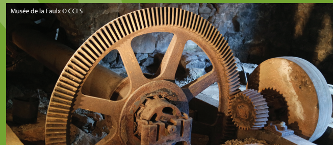
Musée de la Faulx