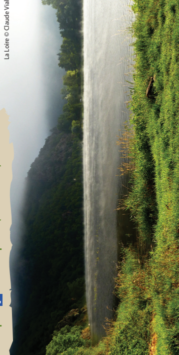
La Loire

Départ : P de l'aire Respirando (Aurec-sur-Loire)