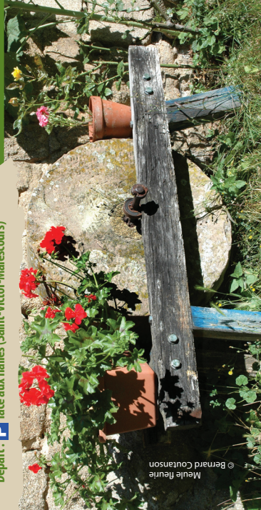
Meule fleurie © Bernard Coulinson

Départ : P face aux halles (Saint-Victor-Malescours)